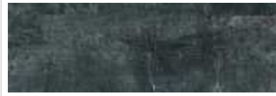
Slate Rio Negro