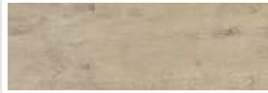
Oak antique washed