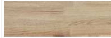
Floor oak washed